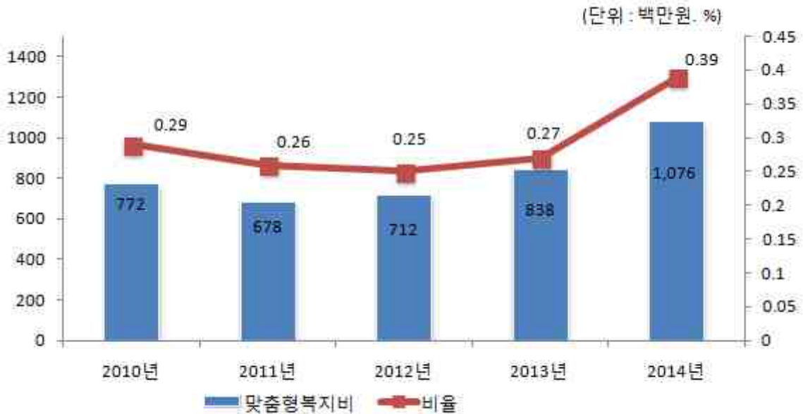
맞춤형복지비 연도별 비교

☞ 2014년 공중보건의도 맞춤형 복지비 대상에 포함되면서 전년도에 비해 맞춤형 복지비 대상인원과 비용이 증가하였습니다.