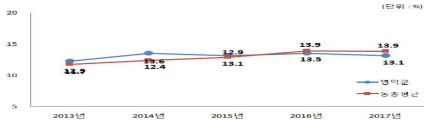
유사 지방자치단체와 재정자립도(당초예산) 비교

□ 우리군 자체세입 대 의존재원의 비중은 자체세입 13.5%, 의존재원(지방교부세, 조정교부금 등, 보조금) 86.9%로 의존재원이 아주 큰 비중을 차지하고 있습니다. 이에 따른 주요 요인으로는 우리군 대부분이 농업 및 어업소득에 의존하는 전형적인 농어촌 군으로써 매년 전체 인구는 감소하는 반면, 노령인구는 증가하고 있으며 주요 소득자원인 대게 소비 관광객이 다소 증가하는 추세에 있으나 점진적인 지방세수 증대에는 한계가 있습니다.