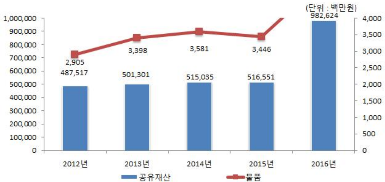
공유재산 및 물품의 연도별 변화